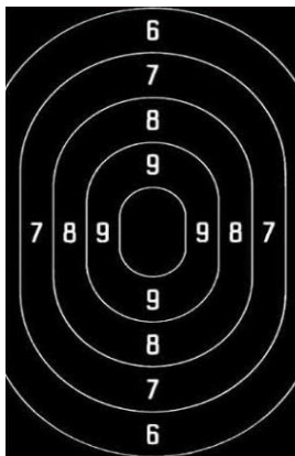
50 m P10